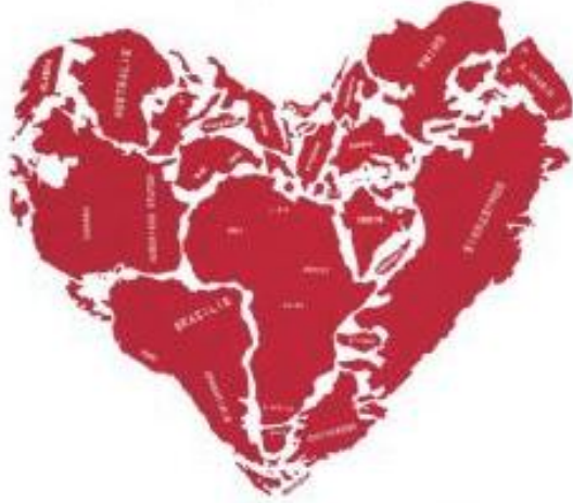
Beeld: Milja Praagman