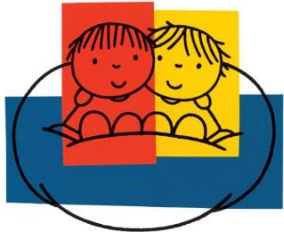
Afbeelding: Dick Bruna